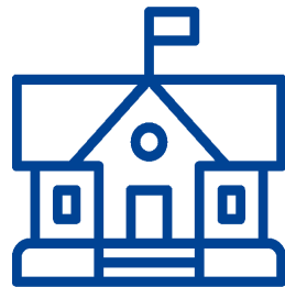
COLEGIO LUGAR DE ENCUENTRO

Nos hemos preparado de manera muy responsable para el re-encuentro en este nuevo año escolar 2022, donde las clases presenciales son obligatorias en todas las fases del plan Paso a Paso.